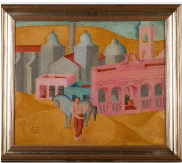
NORAH BORGES. Córdoba en el recuerdo. Retrato de Guillermo de Torre , 1928. Oli sobre tela. Ajuntament de Girona. Col·lecció Rafael i María Teresa Santos Torroella. MHG 13599.