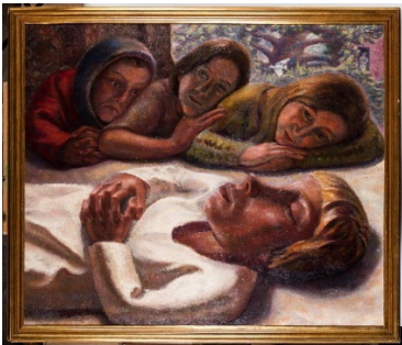
ÁNGELES SANTOS. Niña muerta, 1930. Oli sobre tela. Ajuntament de Girona. Col·lecció Rafael i María Teresa Santos Torroella. MHG 13881.